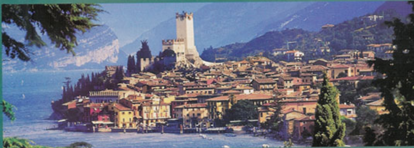
Uno scorcio di Malcesine, borgo affacciato sulla sponda veronese del Garda

S ulla sponda veronese dell'Alto Garda, Malcesine è una delle località più attraenti e attrezzate dal punto di vista turistico: all'ombra del maestoso castello Scaligero, che pare uscito da una fiaba, raccolto intorno alla piazzetta e al porticciolo, il borgo è un insieme di vicoli dove si susseguono caffè, ristoranti e negozietti.